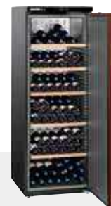
WKr 4211 VINOHEK 200 BOTELLAS 75 CC.