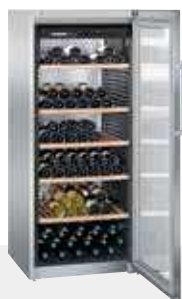
WKes 4552 GRAND CRU INOX 201 BOTELLAS 75 cc