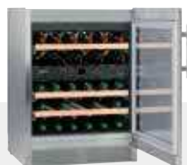
WTes 1672 VINIDOR LIBRE INSTALACIÓN 34 BOTELLAS 75 cc