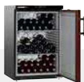
66 BOTELLAS 75 CC.