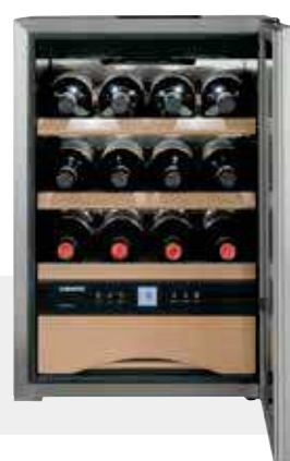
WKes 653 GRAND CRU INOX +5°C/+20°C