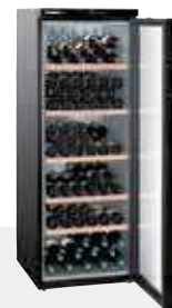
200 BOTELLAS 75 CC.