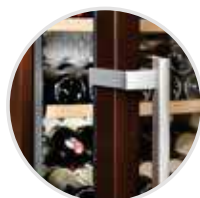
Sistema de atenuación de cierre SoftSystem.