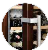
El sistema de atenuación de cierre SoftSystem