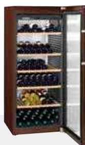
WKt 4552 GRAND CRU 201 BOTELLAS 75 cc