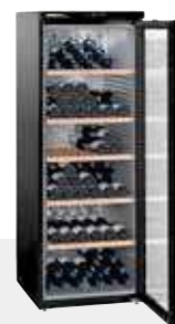
Wkb 4212 VINOHEK 200 BOTELLAS 75 CC.