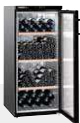
Wkb 3212 VINOHEK 164 BOTELLAS 75 CC.