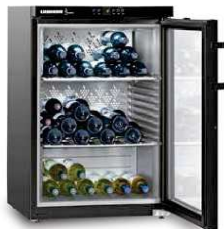
Wkb 1812 VINOHEK 66 BOTELLAS 75 CC..

Cristal de protección a rayos ultra violeta