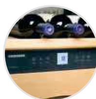
El moderno sistema electrónico