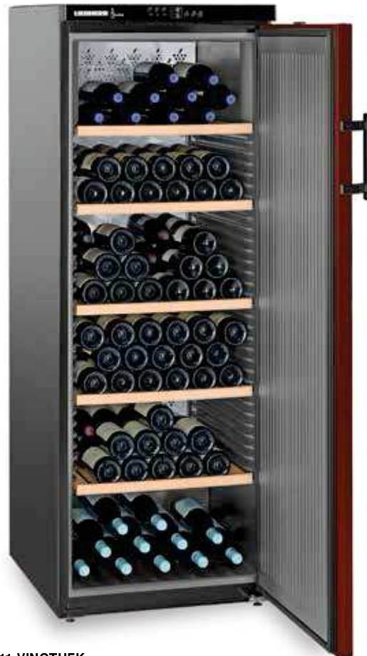
WTr 4211 VINOHEK 182 BOTELLAS 75 CC.

Se pueden regular las temperaturas en la parte inferior entre +5°C y +7°C, en la parte superior entre +16°C y +18°C, y en la parte central se van formando diferentes franjas de temperaturas.