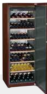
WKt 5551 GRAND CRU 253 BOTELLAS 75 cc