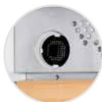
Filtro de carbón activo FreshAir

Terminación 2 Exterior en negro, puerta cristal