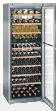
WTes 5972 VINIDOR INOX 211 BOTELLAS 75 cc