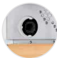
Filtro de carbón activo FreshAir