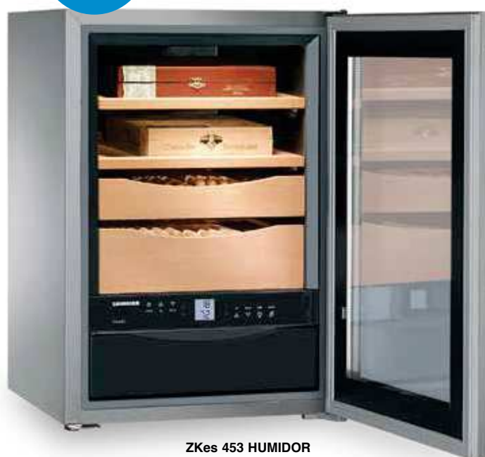
ZKes 453 HUMIDOR INOX +16°C/+20°C