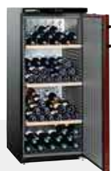
WKr 3211 VINOHEK 164 BOTELLAS 75 CC.