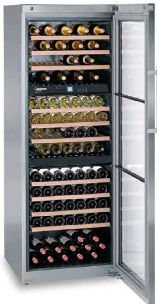
WTes 5872 VINIDOR INOX 178 BOTELLAS 75 cc