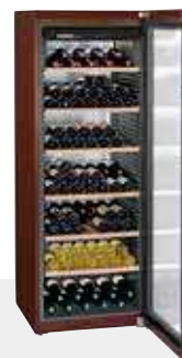
WKt 5552 GRAND CRU 253 BOTELLAS 75 cc