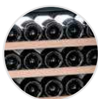
Estantes de madera, extraíbles.